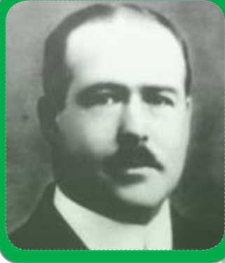
Figura 1. Walter Stanborough Sutton