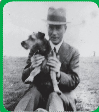
Figura 4. Frederick Griffith