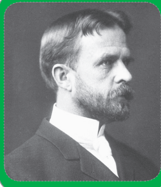
Figura 2. Thomas hunt Morgan

En 1902 Sutton (figura 24), deduce que los cromosomas son la base de la herencia, y que la reducción de los cromosomas en la meiosis está directamente relacionada con las leyes de Mendel de la herencia. Realizó sus observaciones utilizando células de saltamontes. Demostrando claramente que durante la meiosis se reduce el número de cromosomas en los gametos.